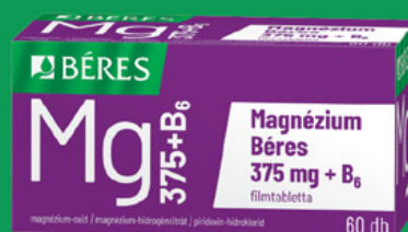
Magnézium Béres 375 mg + B 6 filmtabletta, 60 db (81,2 Ft/db)

Az igazán stresszes időszakokra. A tartós stressz magnéziumhiányt okozhat.