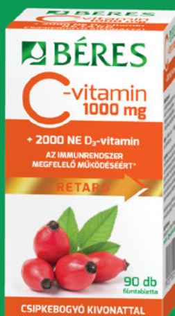
Béres C-vitamin 1000 mg RETARD filmtabletta csipkebogyó kivonattal + 2000 NE D 3 -vitamin, 90 db (50 Ft/db)

Komplex összetételével támogatja az immunrendszert influenza idején.