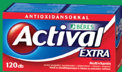
Actival Extra filmtabletta, 120 db (59,5 Ft/db)

Multivitamin 31 hatóanyaggal, vitaminok, ásványi anyagok és nyomelemek.