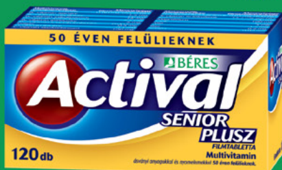
Actival Senior Plusz filmtabletta, 120 db (64 Ft/db)

Multivitamin 50 év felettiek számára ásványi anyagokkal és nyomelemekkel.