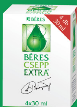
Béres Csepp Extra belsőleges oldatos cseppek, 4x30 ml (52,1 Ft/ml)

Komplex összetételével támogatja az immunrendszert influenza idején.