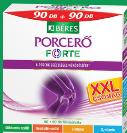
Béres Porcerő FORTE filmtabletta, 180 db (74,7 Ft/db)

A C- és D-vitamin hozzájárul az immunrendszer megfelelő működéséhez.