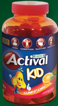
Actival Kid Gumivitamin gumitabletta, 90 db

Cukormentes multivitamin, természetes aromával. A benne lévő összetevők közül az A-, B 6 -, B 12 -, C-, D 3 -vitamin folsav és cink hozzájárulnak az immunrendszer normál működéséhez.