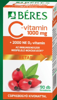
Béres C-vitamin 1000 mg RETARD filmtabletta csipkebogyó kivonattal + 2000 NE D 3 -vitamin, 90 db

Felnőtteknek és serdülőknek napi 1 filmtabletta a magnéziumhiány megelőzésére és kezelésére. Kiválóan felszívódó magnézium vegyületeket tartalmaz.