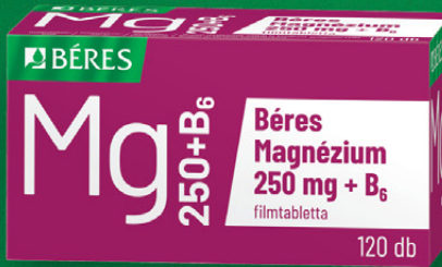
Béres Magnézium 250 mg + B 6 filmtabletta, 120 db

Cukormentes multivitamin, természetes aromával. A benne lévő összetevők közül az A-, B 6 -, B 12 -, C-, D 3 -vitamin folsav és cink hozzájárulnak az immunrendszer normál működéséhez.