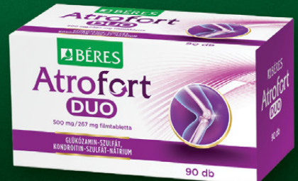
Atrofort DUO 500 mg / 267 mg filmtabletta, 90 db

Komplex összetételével támogatja az immunrendszert meghűléses betegségekben.