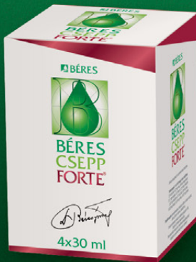
Béres Csepp Forte belsőleges oldatos cseppek, 4x30 ml

Komplex támogatás 800 mg kalciummal (2 filmtablettában).