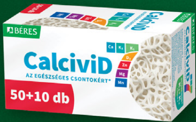
Béres CalciviD 7 filmtabletta, 50+10 db

Komplex támogatás 800 mg kalciummal (2 filmtablettában).